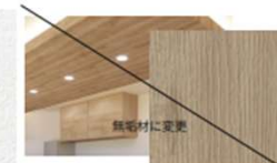
折り上げ天井/ニッチ アクセント FE-76580