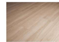
床：L45フローリング グレンジュヒッコリー